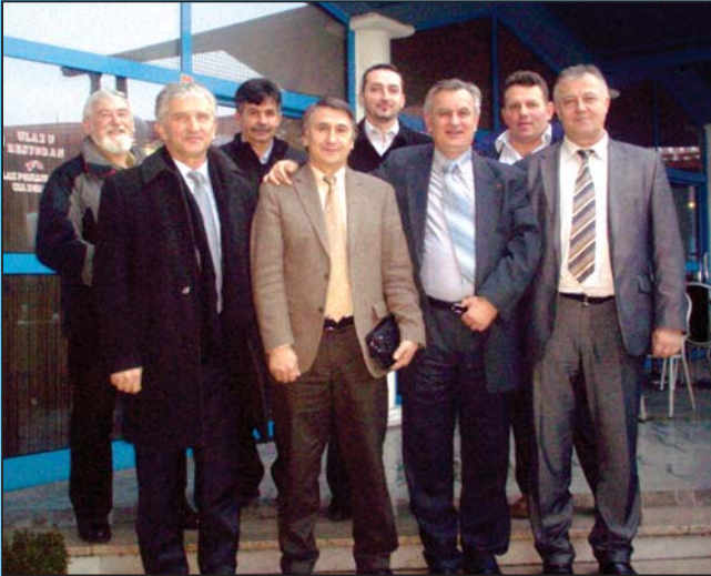
Data su obećanja

U petak, 22. veljače predsjednik Vlade Ze-Do županije, Fikret Pljevljak sa četiri Ministra upriličio je radni posjet općini Usora. Dio razgovora odvijao se u zgradi Općine, a najveći dio vremena gosti iz Zenice boravili su na terenu. Posjetili su Osnovnu i Srednju školu, te Industrijsku zonu u Žabljaku. Uz načelnika općine, Iliju Nikića i njegovih najbližih suradnika, domaćin susreta bio je i Ivo Suvala, predsjedatelj OV-a. Svi sudionici ove radne posjete istaknuli su da se otvoreno i konstruktivno u prijateljskoj atmosferi razgovaralo o zajedničkim projektima, važnim prije svega za općinu Usora. Kao najvažniji projekat predsjednik Vlade, Fikret Pljevljak istaknuo je izgradnju novog mosta na rijeci Usori i rekonstrukciju alibegovačkog mosta. "Idejni projekat već je okončan i ja se nadam da ćemo uskoro ja i načelnik Nikić