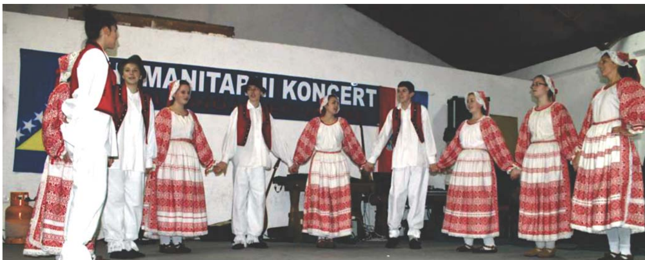
KUD "Izvor" Žabljak