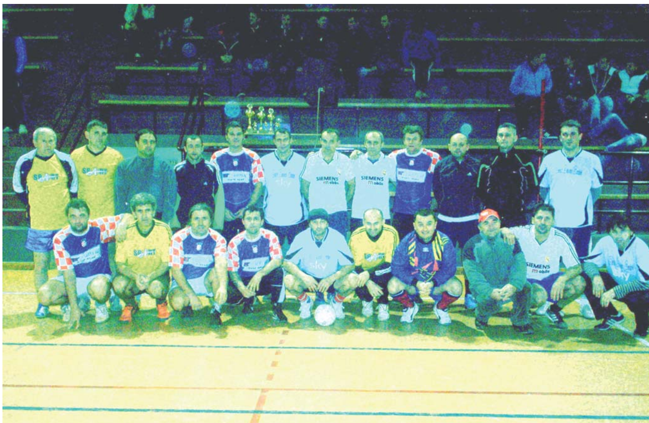
Sudionici završnice turnira