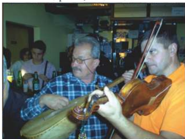
Pijetao i Bagi