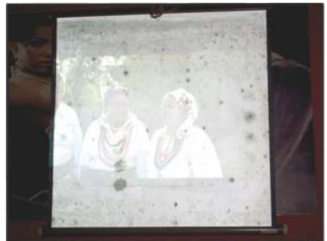
Prvo gledanje DVD-a