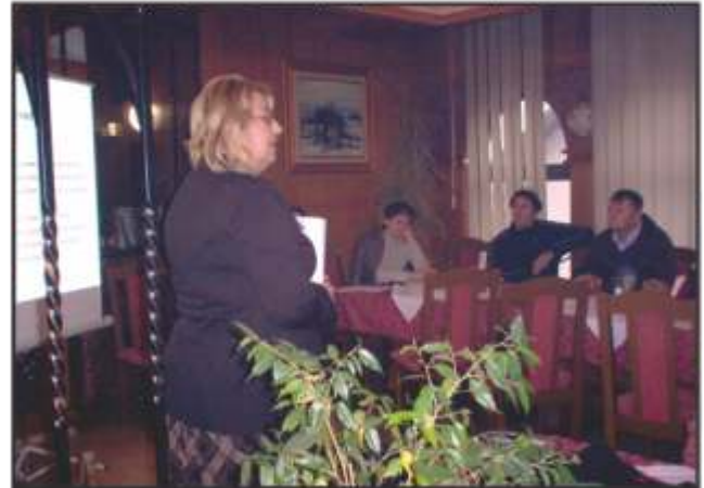
Radna atmosfera na seminaru

OESS-ov terenski ured u Zenici za općinske Vijećnike i Direktore javnih poduzeća 24. studenog u restoranu "Alfa" u Sivši organizirao je seminar na temu "Parlamentarne procedure". Cilj ovog seminara kako se moglo doznati od predstavnika OESS-a bio je da vijećnici promjene svoj pristup i da adekvatno odgovore novim zahtjevima koje nameće novo okruženje i politička situacija u BiH. Na ovom seminaru, koji je imao i prigodne radionice, razgovaralo se o postavljanju dnevnog reda sjednica OV-a, potom o načinima rješavanja problema u lokalnoj zajednici kao i donošenju Odluka na dobrobit zajednice. Članovi OV-a Usora aktivno su sudjelovali na ovom "Satu Parlamentarne