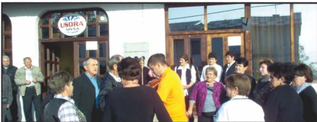
Igralo se i kolo