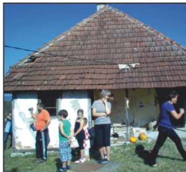
Budući Etno muzej