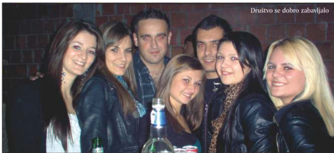
Društvo se dobro zabavljalo