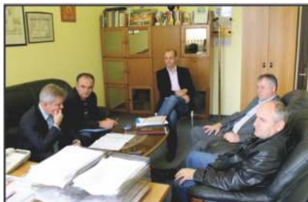
Obećanje je dato