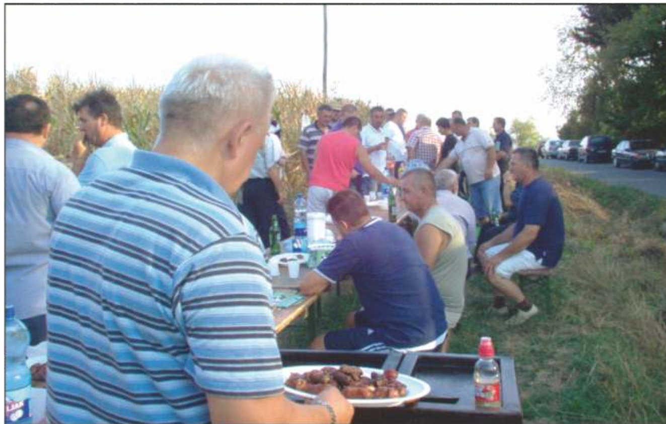
Bilo je i "ića i pića"