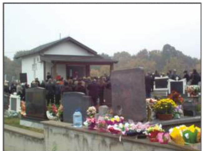
Misa na groblju u Sivši