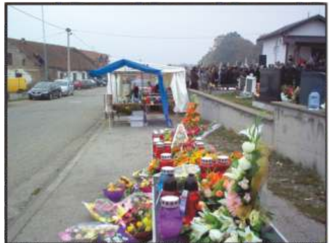
Pomuda cvijeća je bila bogata

"Danas razmišljamo o svojim pokojnicima .Razmišljajući o smrti razmišljamo zapravo o životu, o njihovom životu ovdje na zemlji, ali i o njihovom životu ondje u vječnosti. Mi se na poseban način prisjećamo svih onih pokojnika koji su dali svoje živote braneći ovdje naš dom, našu domovinu. Danas smo im posebno zahvalni i za njih molimo. Želimo da njihova žrtva koju su podnijeli braneći dom i domovinu, bude nagrađena od nebeskog oca", kazao je međuostalim u svojoj propovjedi vlč. Ivan Bošnjak.